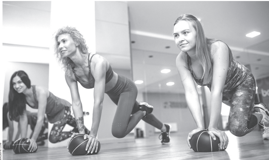
Физическая активность в любом возрасте полезна

Рак молочной железы: Самообследование каждые 2–3 месяца (желательно в первую половину цикла, а это примерно 5–7 день цикла). УЗИ молочных желез с 18-ти лет и до 90 лет ежегодно. С 40-ка лет цифровая