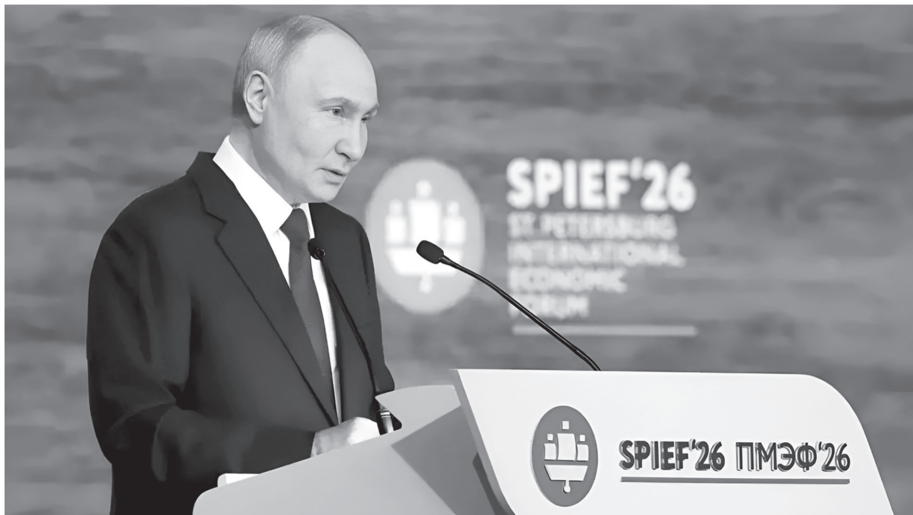
На пленарном заседании форума на тему «Прагматичный диалог — путь к стабильному будущему» выступил Президент страны Владимир Путин

Основой экономики, по его словам, является частная инициатива. Государство уже создало базовые условия для бизнеса, но теперь нужно сосредоточиться на устранении финансовых ба-