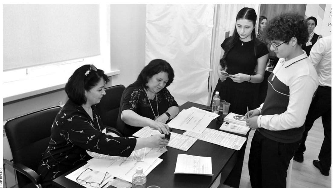
Сотрудники Избиркома КЧР познакомили ребят с основами избирательного права

главной избирательной кампанией в Карачаево-Черкесской Республике в 2026 году станут выборы депутатов Государственной Думы Федерального Собрания РФ, которые состоятся в Единый день голосования — 20 сентября 2026 года.