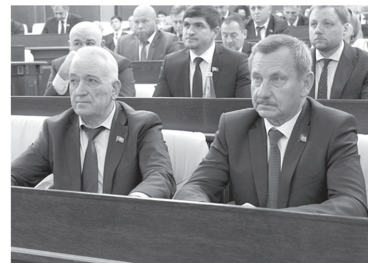
На сессии депутаты рассмотрели более 20 вопросов

Изменениями предусмотрено, что лица, замещающие государственные должности, в том числе Глава КЧР, больше не должны ежегодно подавать сведения о доходах, об имуществе и обязательствах имущественного характера, так как контроль за денежными средствами и имуществом лиц, замещающих государственные должности, и членов их семей стал непрерывным и осуществляется в режиме