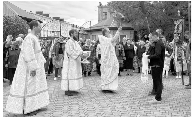
В Никольском храме в Черкесске с теплотой и любовью вспоминали Николая Угодника

Николай Чудотворец и сегодня приходит на помощь, если попросить его от чистого сердца, считают верующие. Недаром его называют «теплым заступником и скорый помощник».