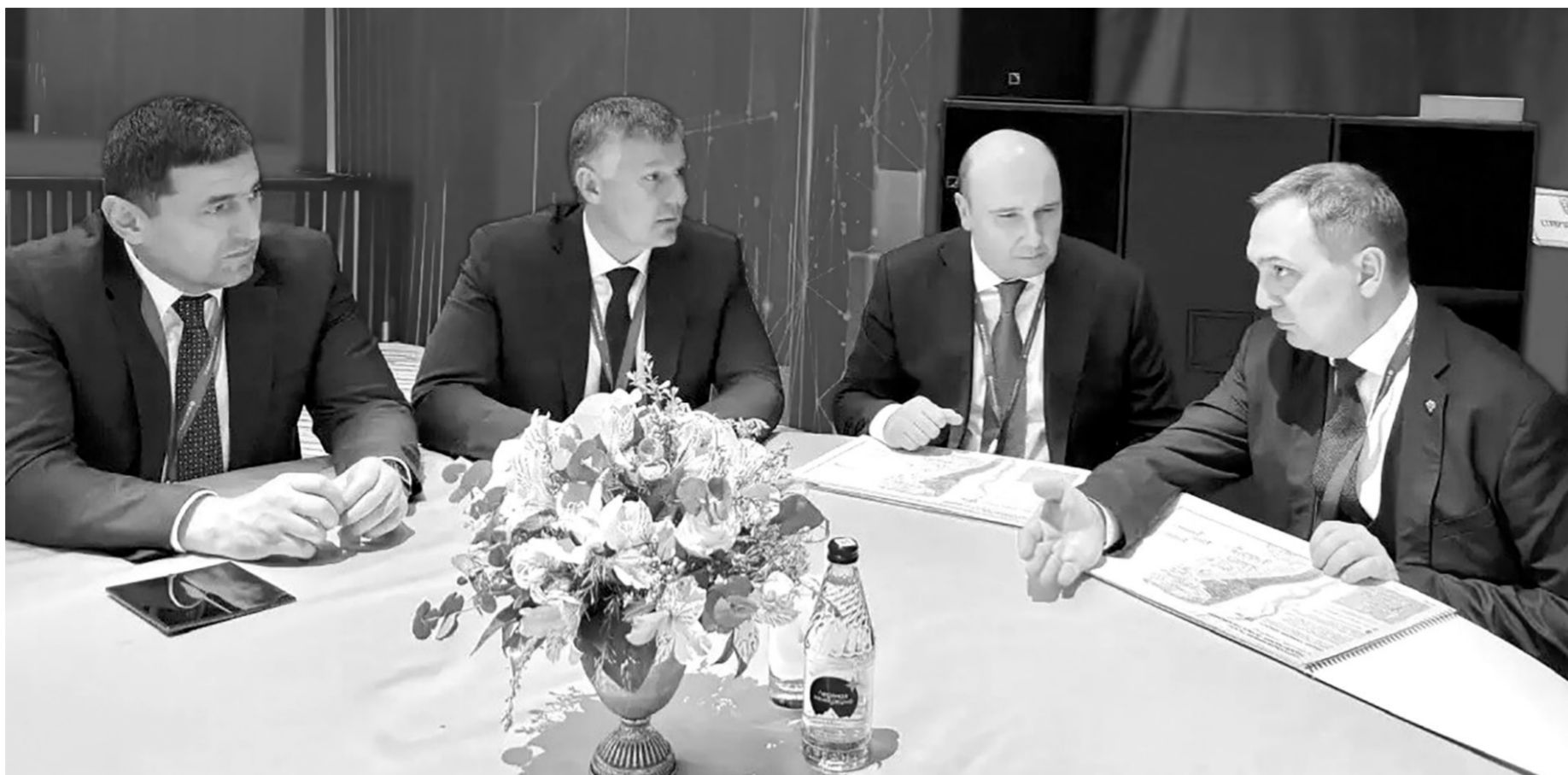
В рамках Кавказского инвестиционного форума мэр республиканской столицы Алексей Баскаев презентовал заместителю министра строительства и ЖКХ России Алексею Ереско проект по благоустройству набережной реки Кубань в Черкесске

— По поводу жилья среди городов России мы занимаем высокие позиции. В прошлом году в эксплуатацию введено почти